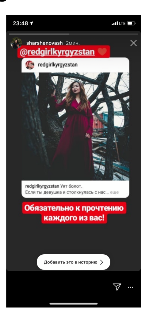
[Read it, guys. If woman fights for righst, it is not only feminism]